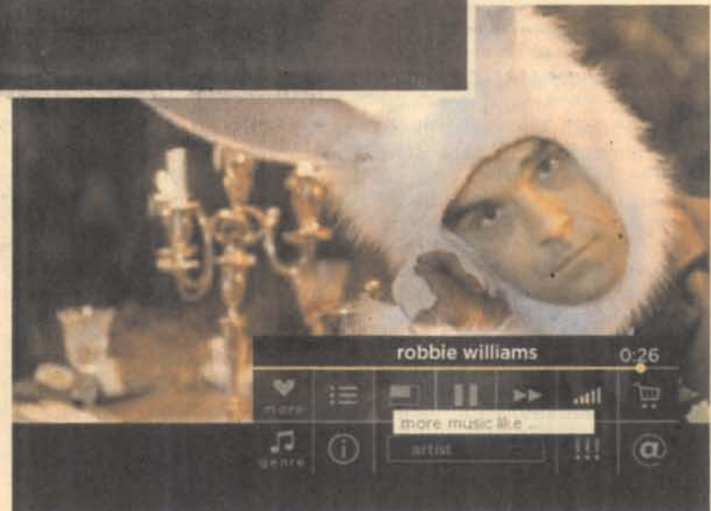
Vier Farben Musik: Auf Webplattformen wie Tape.tv oder Myvideo spielen Stars aller Musikgenres auf. Von oben links im Uhrzeigersinn: Britney Spears, David Hasselhoff, Robbie Williams und Michael Jackson